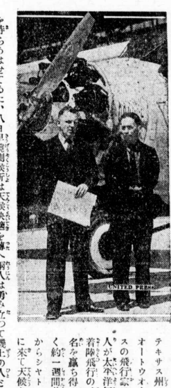
北太平洋 無着陸飛行 壮圖決行