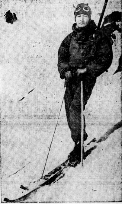
長崎船務各山登のカーへ州華 華各山登のカーへ州華 華各山登のカーへ州華