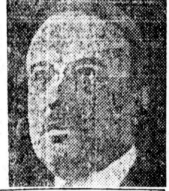
瓦壊の原因 失業救済公債 三千四百萬圓 發行正式決定