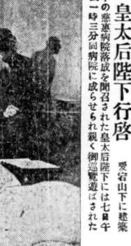
皇太后陛下行啓... 皇太后陛下は七月廿一日...