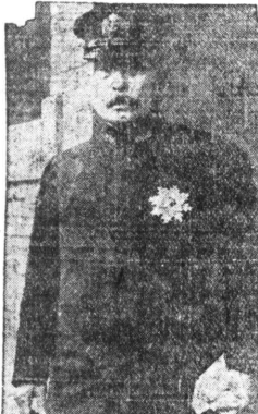
（東京九日電）財部海相の答辯に不満足を感じ、閣議は注目を浴びて散會した。