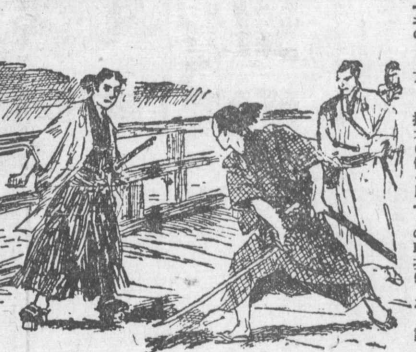
清川八郎の肖像画