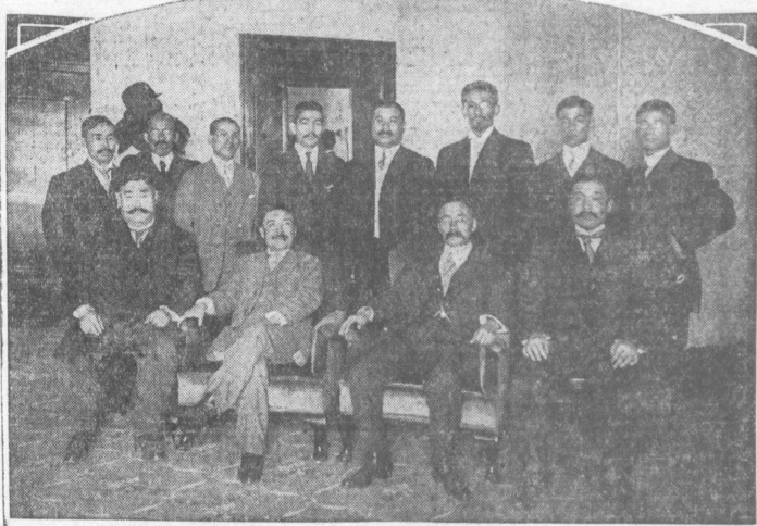
招主名國故の自日在並計の園地毎の事年一九一の前百一は前... 編故編交は士博戸渡新も九米渡氏兩士博進納戸渡新... 氏三田島十歳代月九年開て應に聘... のもたし影態に共三表代の渡是は真寫の此がたしを演講察観て地各たつあててし...

結婚を拒絶され 娘の両親を射ち自殺す 旅館業白木原氏死し夫人は重態 雇傭人田守茂青年の兇行