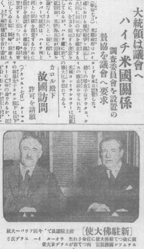
新駐佛大使 (使大佛駐新) 統大バウフ回今て員院院上府