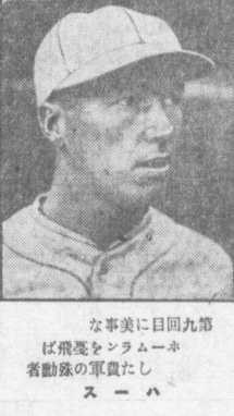
な事美に目回九第... 者動殊の軍軍たス...