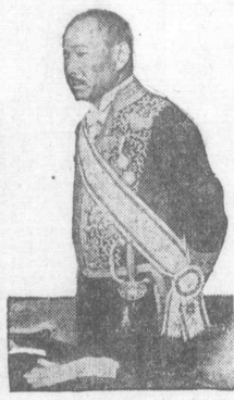
三土前藏相致電の電報文...