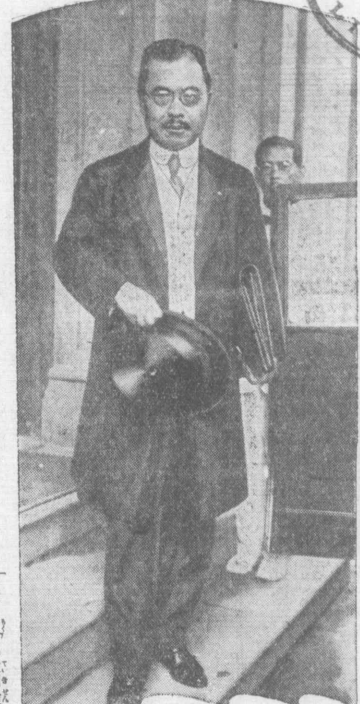
本社特約電通合同電報