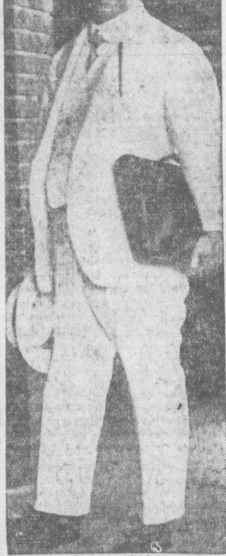
Baron Kijuro Shidehara, Japanese Foreign Minister, who may mediate for the settlement of the present controversy between China and Russia over the Eastern Chinese Railway.