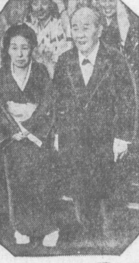
Viscount Shibusawa—widely known among Americans as the "J. Pierpont Morgan of Japan," is shown with his wife during celebrations of his 90th birthday.