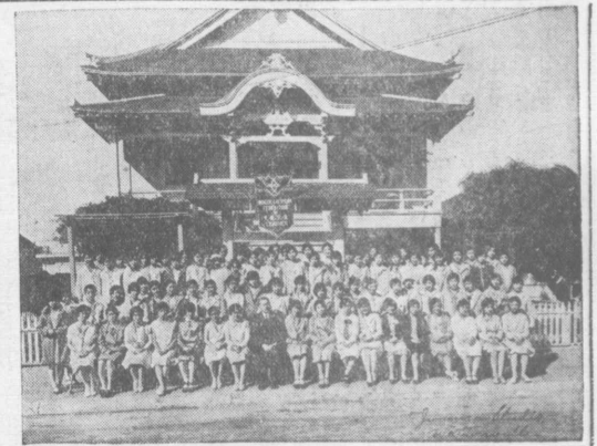
北米佛敎女子青年會聯誼大會 出席者一同