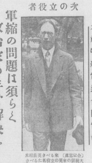
米相首美きべる米 (真喜岡合) 大 氏ズンボ