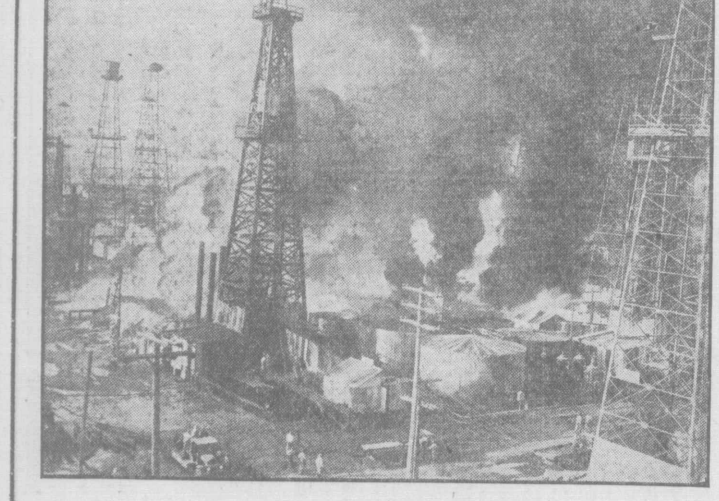
景光の火大田油井フタンサ

送別のラツハ勇しく 少年團の鹿島立ち 埠頭人で埋まるの盛況 桑港少年團 埠頭に送る