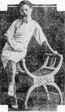
A Chinese mannequin of today—a new note in the dress of Eastern countries. She is modeling latest creations for Oriental shoppers.