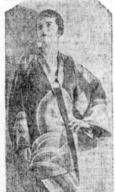
Rainbow colors arranged in circular arcs form the brilliant modern pattern introduced on black crepe which created especially for a coolie coat.