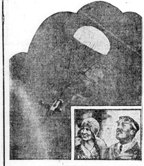
飛行機の落下試験... 飛行機の落下試験... 飛行機の落下試験...