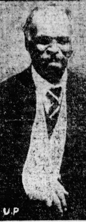
Senator Charles Curtis, G. O. P. Vice-Presidential nominee, shown at Kaw City, Okla., with his right arm in a sling. His hand was injured when a car door slammed shut on it.