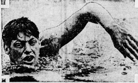
Johnny Weismuller, "human speedboat," who will arrive in Yokohama today to compete in International Swimming tournament to be held in Tokyo next month.