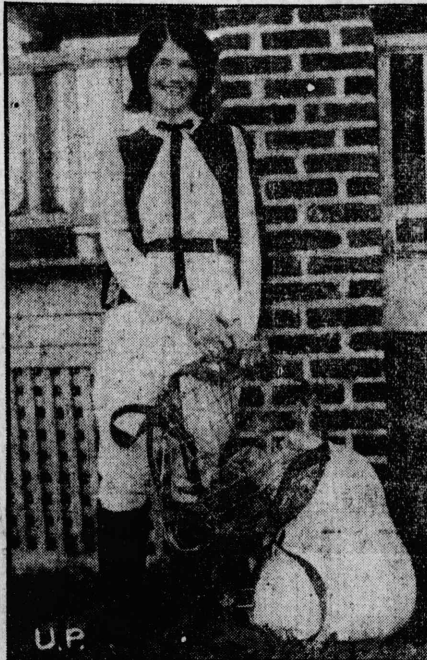
夫人アム人美の歳九十の陸着事無てひ用を傘下落りよ沢千三空高