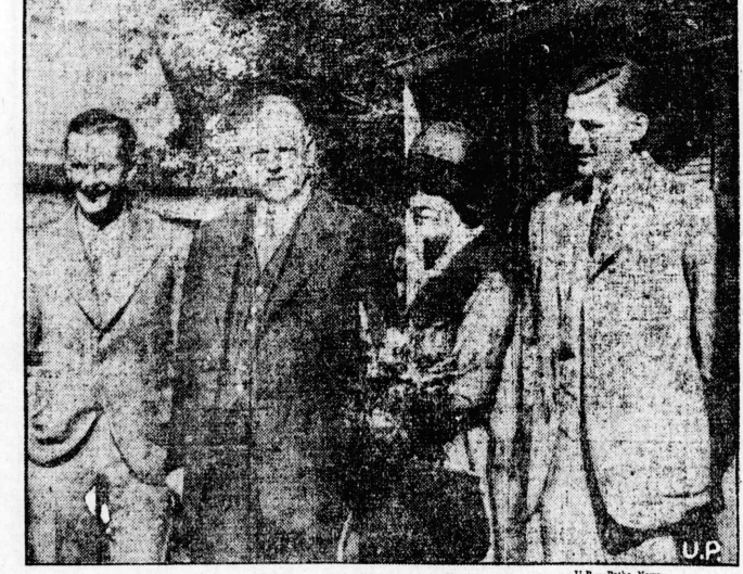
The Hoover family at the "old home town," West Branch, Ia., where the Republican nominee delivered one of the most important speeches of his campaign. Left to right, Allen, Mr. and Mrs. Hoover and Herbert, Jr.