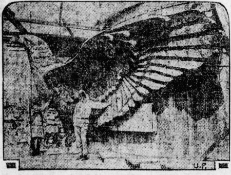
The clay model for the eagle that will be placed on top of the Coolidge Dam in Arizona is being given the finishing touches. It measures 33 feet, 9 inches from tip to tip of the wings and stands 10 feet, 3 inches high. Forty tons of concrete will be used to complete the eagle.