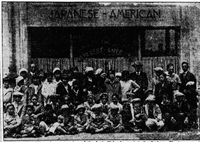
Here are the fifty and more members of the Junior Club who went to the Orpheum Theater as guests of The Japanese American News yesterday. Do you see yourself in the photograph? The story about the Junior Club's day at the Orpheum will be found on the last column of this page. Don't fail to read it. This photograph was taken at 12:30 o'clock Monday afternoon just as the Junior Club members were about to leave for the Orpheum.