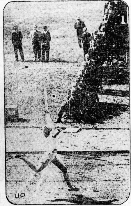
Sweden has adopted a novel method of deciding races. Seventeen judges sit in ladder formation and a majority is necessary to select a winner. In this picture Maud Sunborn is shown winning the 100-meter Olympic trial dash to set a new Swedish record of 13.1 seconds.