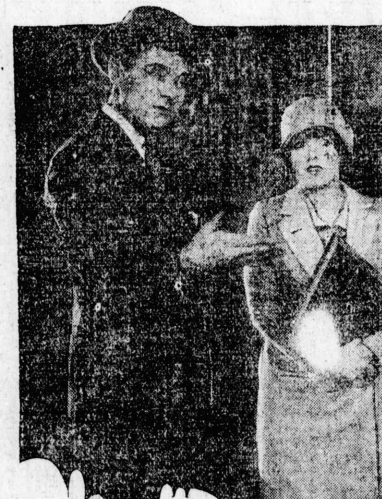
福幸を、しかし、たつかぬがらは福幸へは間時教はに たつかなるつ宿は喜ながらはのへま間時教はに