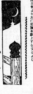
愛憎乱麻 下村悦夫作