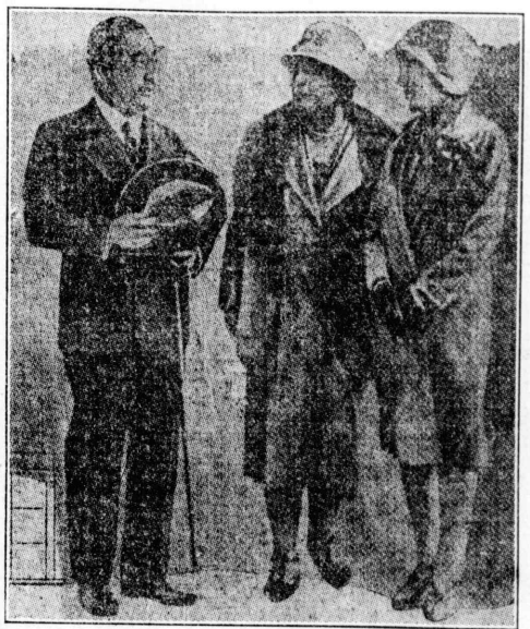
悦びに満ちた 松平大使夫妻と節子姫 華府出發前の寫眞