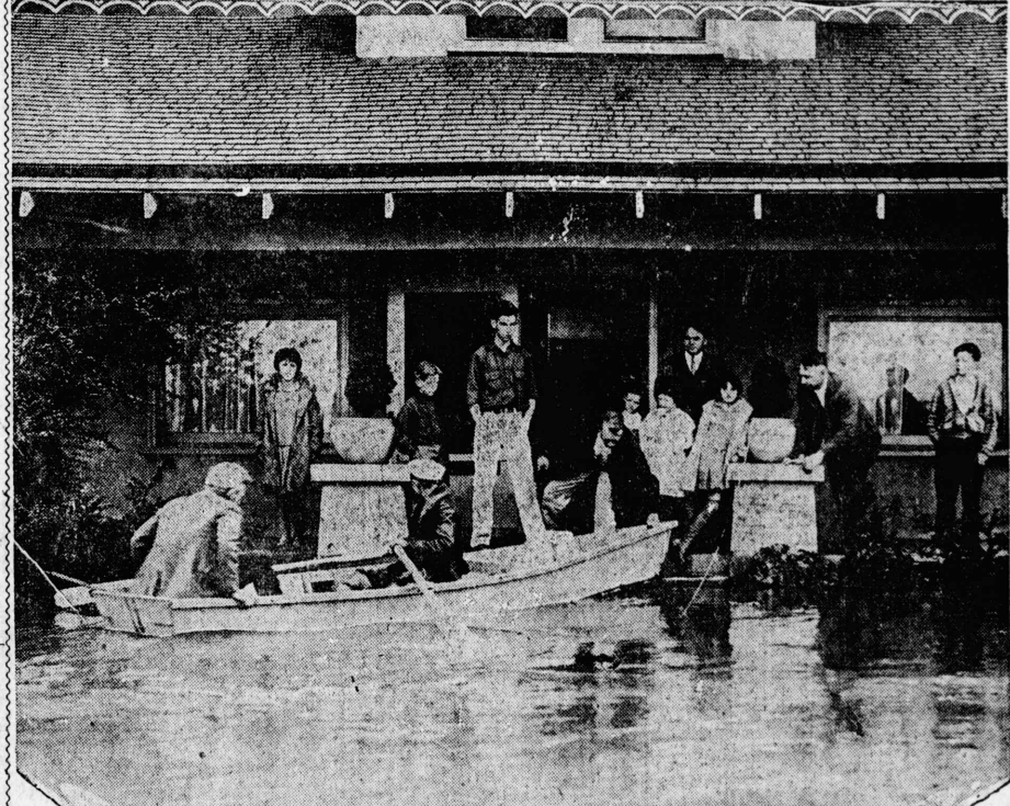
關機通交の一唯がトイボ 況實の害水府櫻