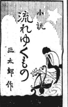
流れるゆゑの 三太郎作