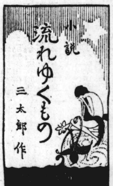
流れゆくもの 三太郎作