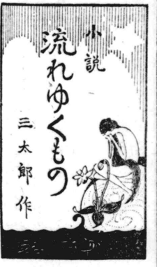
流れゆくもの 三太郎作

「流れゆくもの」 三太郎作 「流れゆくもの」 三太郎作 「流れゆくもの」 三太郎作