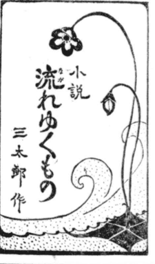
小説 流れゆくもの 三太郎作

淋しき友 十一 うつつも無く聞いたことか の馬の嘶に眼をさめた、夜は スワカリ暮れてきた。