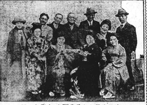
行一家花立家週我曾たも桑來日昨