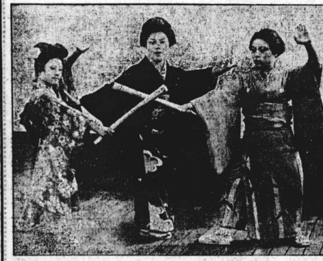
今夜開演の曾我廼家

須市市民は、市支配人制を要求している。市民は、市支配人制の導入を強く望んでいる。