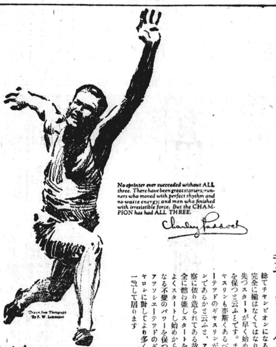
Chasley Paddock breaking the tape with his famous "jump finish" that has brought him 37 out of a possible 40 world's sprint records and an unequalled mark of 9.5 seconds for 100 yards, made May 15, this year.