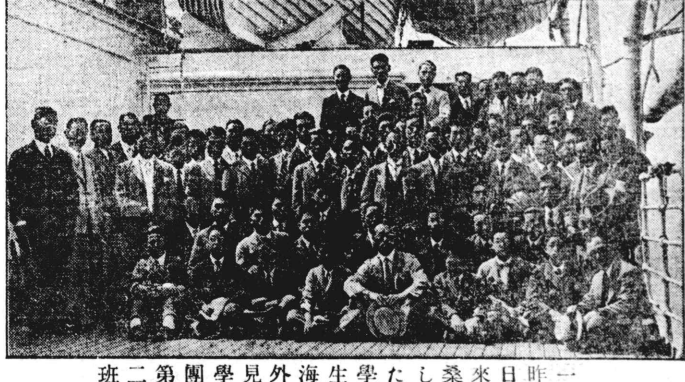
昨日來日桑來日學外見團二第班