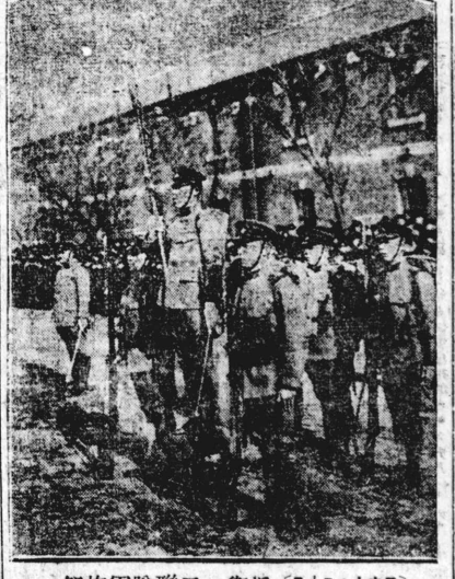
祭儀軍隊聯一衛近 (スユニットオフ) 祭儀軍隊聯一衛近 (スユニットオフ) 祭儀軍隊聯一衛近 (スユニットオフ)