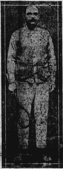
氏トドルグ手選府貴

I have traveled around the world, but never met a single devil.—Japanese proverb. Knowledge comes, but wisdom lingers.—Tennyson.