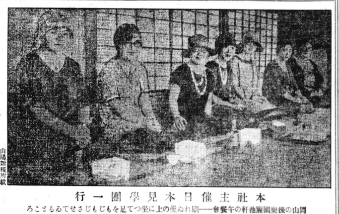
本主催本日見學一行の山陽園園樂軒會餐