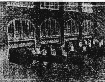
習練戦生學女大スミ州アツセユナマ