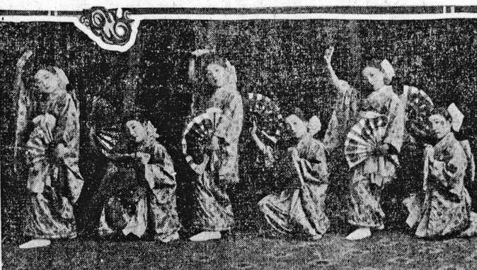
▲八月 十五日までに、生葡萄の出荷は、前年より増加した。これは、天候の好都合によるものと見られる。八月の生葡萄の出荷量は、前年より約二割増加した。これは、天候の好都合によるものと見られる。

▲十月 十日、十一日、十二日は、生葡萄の出荷は、前年より増加した。これは、天候の好都合によるものと見られる。十月の生葡萄の出荷量は、前年より約二割増加した。これは、天候の好都合によるものと見られる。