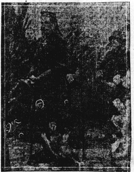
りけに前發突件事爆大の派激過... 下隆スリ王利牙勃て立に監加