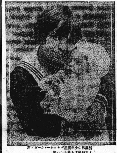
君シガクキキヤダ星明年少の界畫活