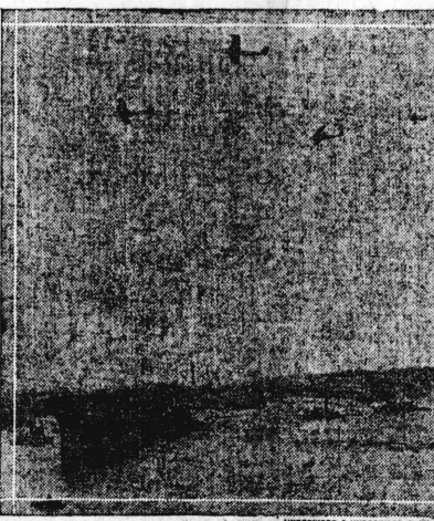
(號ガトラ機母行飛造新の軍海國米) 臺十七機飛行あり長の八十八八十八 才を力速の里海三十三し戦格を