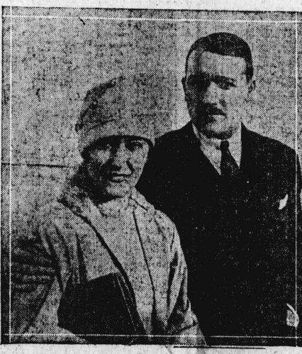
MINSONS W. A. F. ...