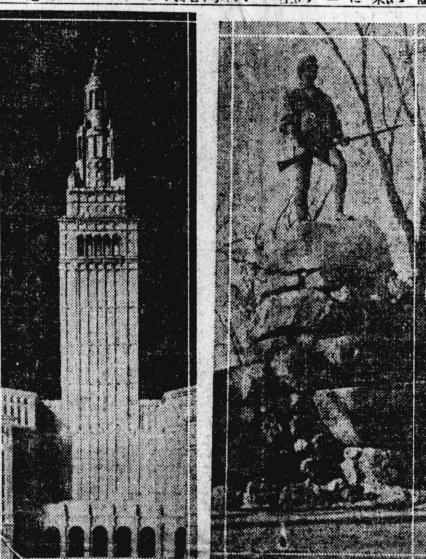
ドナラブリク 塔高の場車停新 記の火砲一第軌立獨 づ建に二トキレ観念