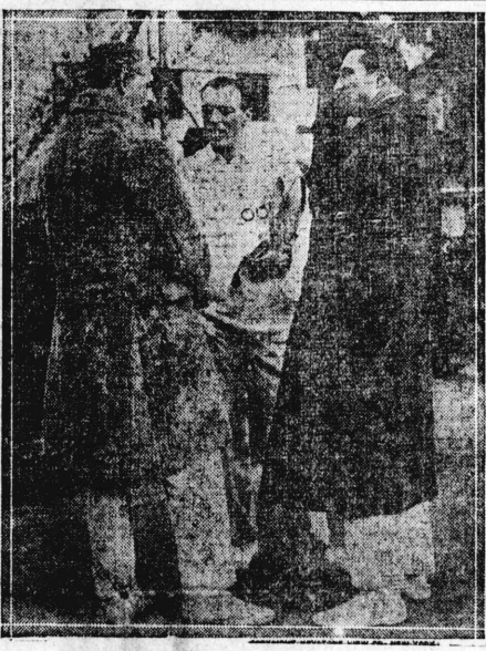
パーモ手選球庭園同 [右]伯ムラサ利太伊 [左]一ユードンモルコ [中]氏一ゾー