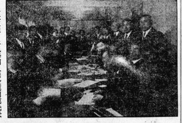
本社主催日本見學團入選投票開票光景 本社東京特電 二月十八日正午電