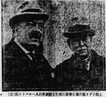
(左)トパールへ人界昇歌る来れに前軍に属の家オテラ院上