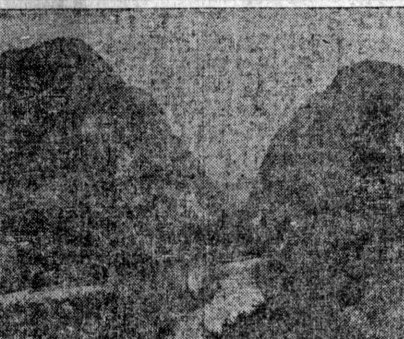
比島マニラの水源地ニシテ...