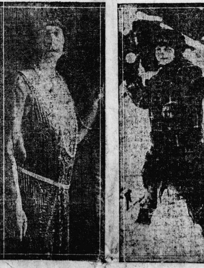
少年時代の聖徳太子 少年時代の聖徳太子