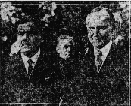
氏ゲツリク領統大國米氏スエカ領統大國英